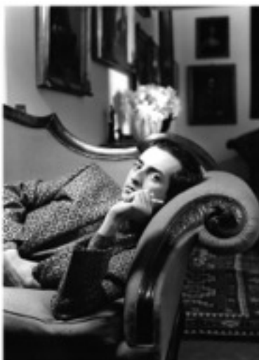
Toni Thorimbert Ritratto di Giovanni Gastel, 1985