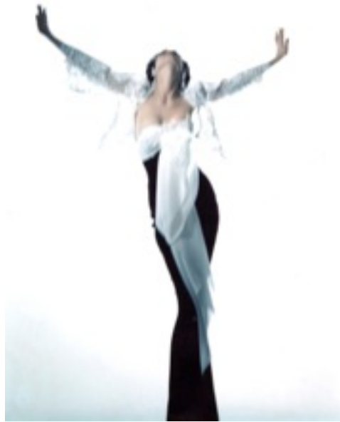
Giovanni Gastel Untitled (Gina) , 1992