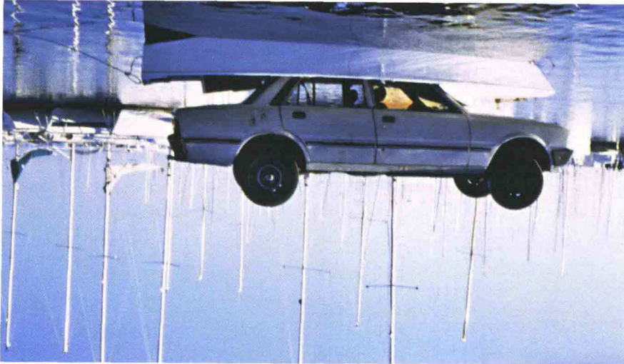
MIKE KELLEY/ L'artista americano scomparso da poco è celebrato nella retrospettiva Eternity is a Long Time, che si concentra soprattutto sugli anni dal 2000 al 2006 (foto, John Glenn, 2001, detail, studio view). Hangar Bicocca, Milano, fino al 8/9, www.hangarbicocca.org