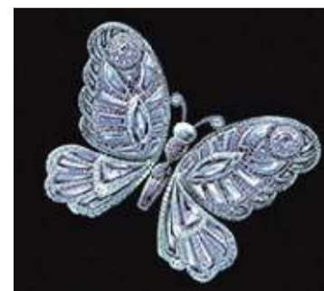
LA NATURA A sinistra un gioiello floreale firmato Dior e accanto la spilla a farfalla di Chopard

spruzzi di acqua e fiori multicolor in zaffiro. Il mood romantico cattura i movimenti dei petali mossi dal vento, gli orecchini stessi non sono mai in coppia, ma ognuno racconta un diverso momento e la spiga di frumento, per esempio, si abbina alle foglie di alloro.