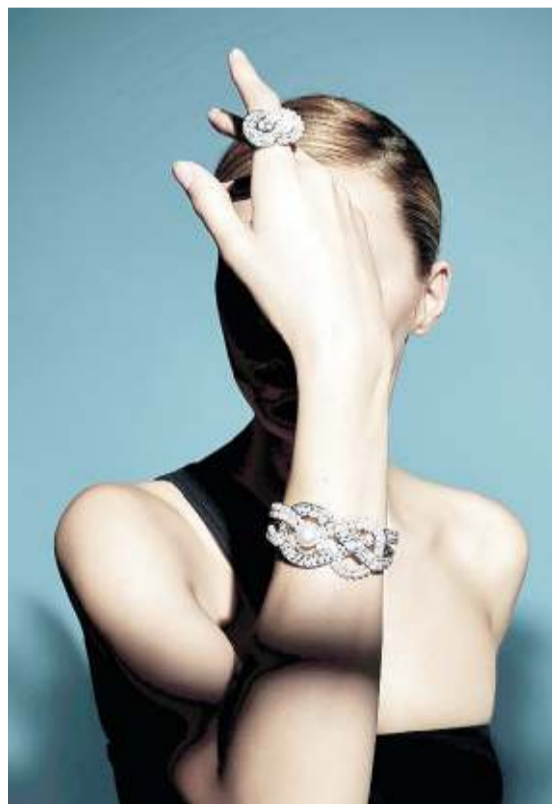
NUVOLE Bracciale e anello Chanel Flying Cloud