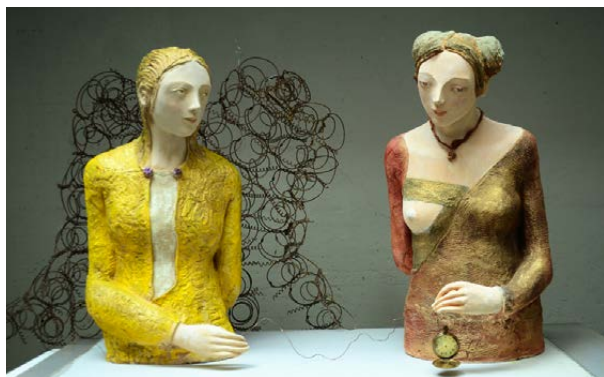
Costanzo, Angels , 2016, terracotta policroma, dimensioni varie.

VIA CHIAPPONI 39. Le sculture di Cristina Costanzo (Piacenza, 1970) strizzano l'occhio alla ritrattistica rinascimentale. Le sue figure femminili, spesso a mezzo busto e modellate nella terracotta policroma, citano i capolavori di Andrea del Verrocchio e di Francesco Laurana e si rifanno ai volumi dei corpi dipinti da Piero della Francesca. Piccoli oggetti di recupero trovati nei mercatini, come orologi da tasca, collane, fermagli e bottoni, completano l'abbigliamento di questi personaggi sognanti. Fino al 26 marzo Biffi Arte (tel. 0523-324902) propone una selezione di lavori, riuniti nella personale dal titolo Anime leggere . Prezzi da 1.500 a 3mila euro, con punte fino a 5mila euro per le opere di maggiore formato.